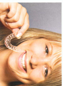
CLEAR-ALIGNER klar-transparent ...