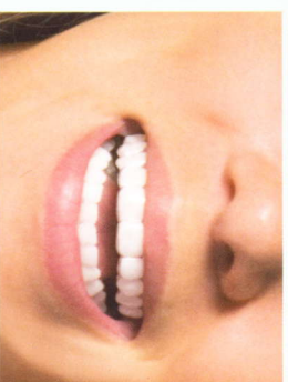
auch im Mund